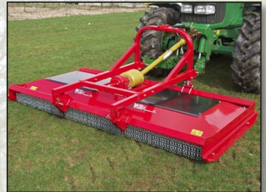
Frontgezogener Bock + Kettenschutz