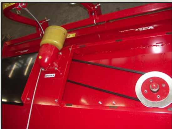
Große Stahldeckel für einfache Zugänglichkeit

Der Rahmen ist besonders steif durch Verwendung einer Kastenkonstruktion an der Vorder- und Hinterseite. Die ganz glatte Unterseite sorgt gemeinsam mit den Zwischenwänden und den renommierten Votex Doppelmessern für eine große Kapazität, hervorragende Mähqualität und eine vorzügliche Verteilung über die ganze Maschinenbreite des gemähten Gewächses. Der Super Bingo Sichelmulcher hat ein besonders günstiges Preis/