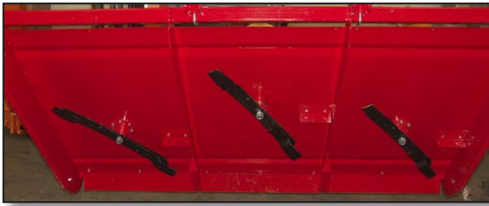
Glatte Unterseite und Zwischenwände. Keine Gewächsförderung zwischen den Messern