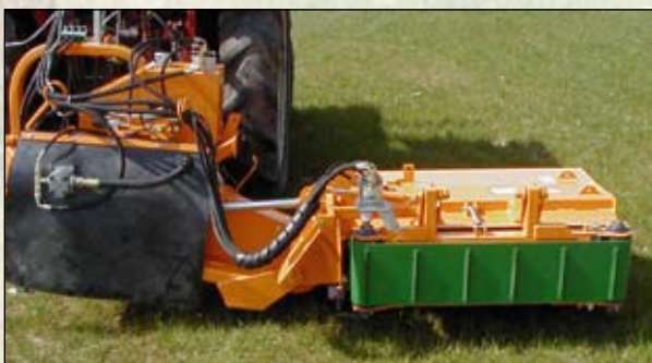
Spezialausführung mit Grasförderband