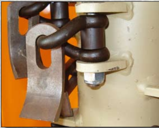
Votex 40x12 Schlegeln